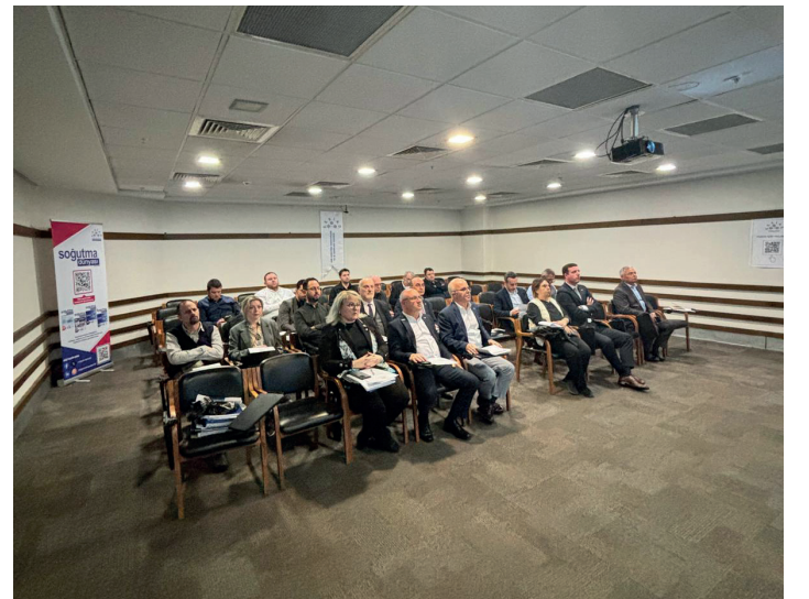
ESSİAD Mali Genel Kurul Toplantısı