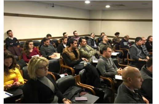
Seminer, sektör firmalarının yoğun katılım ve ilgisi ile gerçekleştirildi.