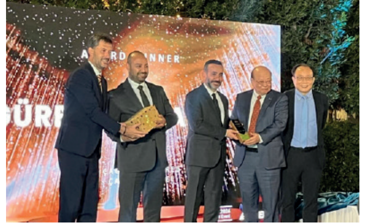
DELTA EMEA, Partner Etkinliği, Malta, 2024

Birçok sektöre ürün tedarik ediyor olmamız sebebiyle çok farklı projelerde aktif rol oynuyoruz. Bu yıl özellikle havalandırma, pompa, paketlenme ve otomotiv sektörlerinde çok aktif rol oynadık. Hem mekanik, hem de otomasyon tarafında büyük projeler geliştirerek müşterilerimize çözüm ortağı olduk.