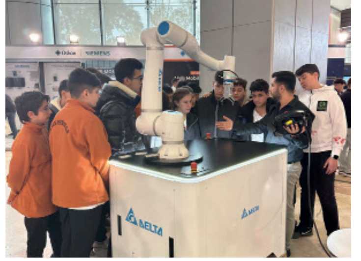
FIA TECH 2024 Fuarı

Gürel Otomasyon, fuar süresince dijitalleşen üretime yönelik sunduğu yenilikçi otomasyon ve enerji çözümlerini ziyaretçiler ile paylaştı.