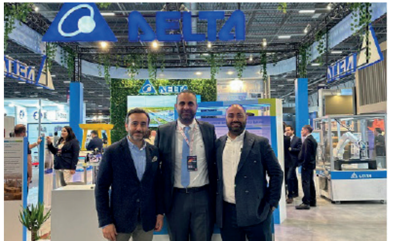
WIN Otomasyon Fuarı 2025

Hedef pazarlarımızı belirlerken, özellikle yeni