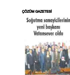
AYLIK ULUSAL DERGİ İSTANBUL MESLEKİ

ÇÖZÜM GAZETESİ Soğutma sanayicilerinin yeni başkanı Vatandaş oldu